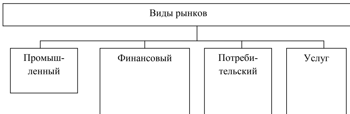
Рис. 1 - Классификация моделей пенсионного обеспечения

Примечание - Составлено автором по данным Росстата.