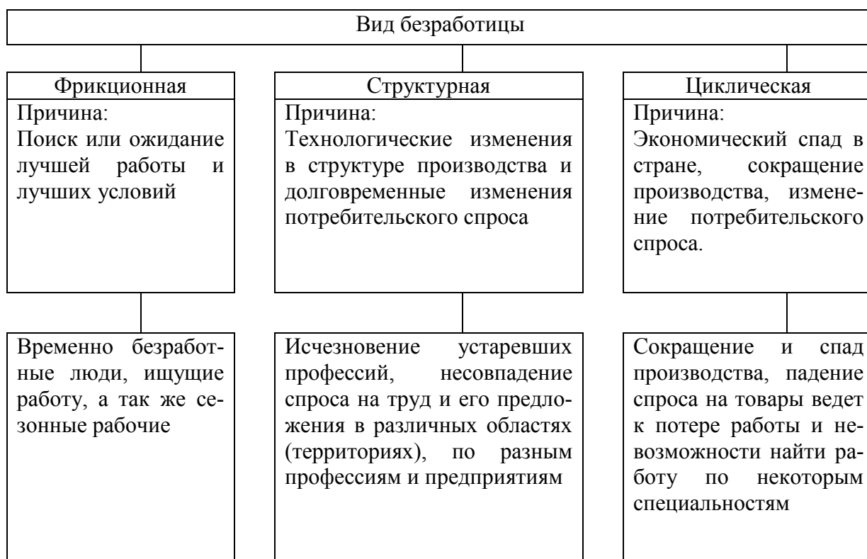
Рис. 1.1 - Виды безработицы

Примечание – Капелюшников Р. И. Общая и регистрируемая безработица: в чем причины разрыва?. - М.: ГУ ВШЭ, 2002. – С. 48.